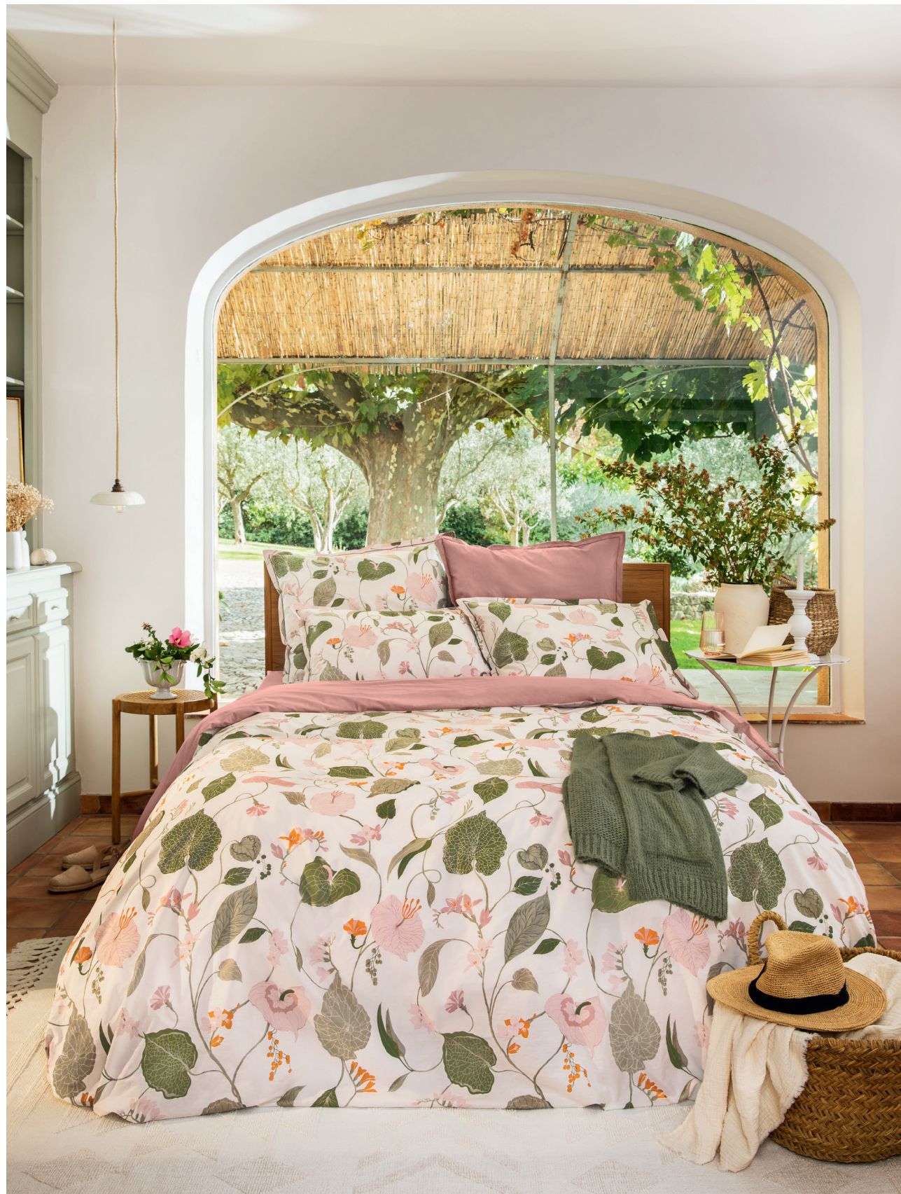
Imprimé végétal. Uni rose. Finition bourdon vert. Percale 100% coton, 80 fils/cm 2 . Taie d'oreiller imprimée, dos uni, finition bourdon, petit volant 50 x 70 | 26€ Housse de couette avec cheminée, une face imprimée, une face unie 140 x 200 | 89€